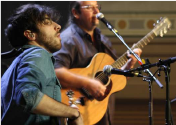
Les musicales de la Soierie 2020

OUMANE c'est des ambiances musicales mêlant le plaisir de naviguer sur une mer calme pour partager leur univers. C'est aussi une tempête pour faire plonger le public au cœur des chansons. Tantôt une communion, tantôt une envie de surprendre, pourquoi pas de choquer. Une invitation au débat et aux réflexions avec une envie d'entretenir le doute plutôt que la doctrine.